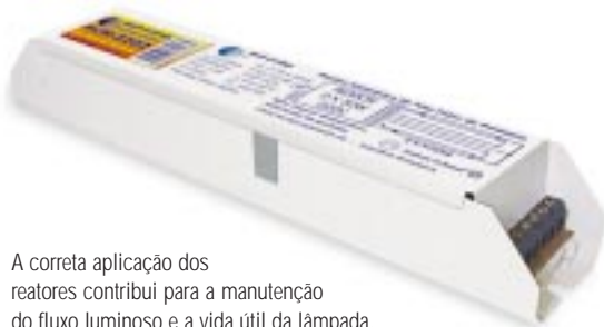
A correta aplicação dos reatores contribui para a manutenção do fluxo luminoso e a vida útil da lâmpada.

A correta aplicação dos reatores garante melhor desempenho para os projetos elétrico e luminotécnico, contribuindo diretamente para a manutenção do fluxo luminoso e vida útil da lâmpada.