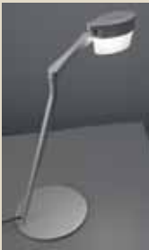
Sweet Table - Studioluca Iluminação Ltda, Designer: Toni Dias 1º lugar Residencial para Mesa