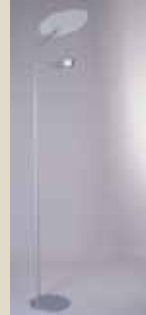
Flash - Studioluca Iluminação Ltda Designer: Toni Dias 1º lugar Residencial para Piso