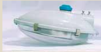
Alpha - Tecnowatt, Designer: Depto. de Pesquisa e Desenvolvimento de Produto 1º lugar - Iluminação pública