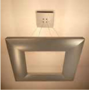
Quadrus Pendente – Light Design Designer: Fred Mamede 1º lugar - Iluminação Residencial Teto