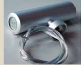
Focus 2 – Magica e Funzionale Ilumina Ltda Designer: Giuseppe De Renzis, 1º lugar - Monumental