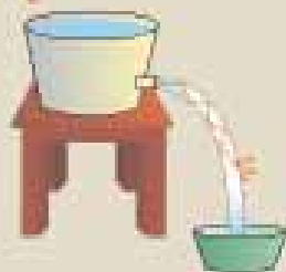
Síntese da experiência de John Tyndall, primeiro relato de que se tem notícia da transmissão guiada de um feixe luminoso.