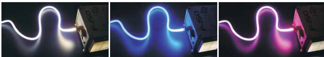
Cabo de emissão de luz lateral ou sidelight .

Podem ser acoplados terminais que permitem acabamento, controles de ângulo de fecho ou efeitos de difusão.