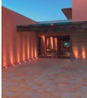
No lobby, aparelhos embutidos no forro, com lâmpadas AR70, ressaltam o requinte da ambientação, e dicróicas destacam obras de arte.