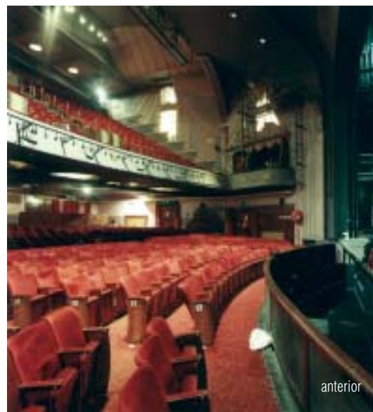
O auditório antes da nova reforma.

Os arquitetos projetaram uma “segunda pele” para o auditório, composto de painéis acústicos sobrepostos.