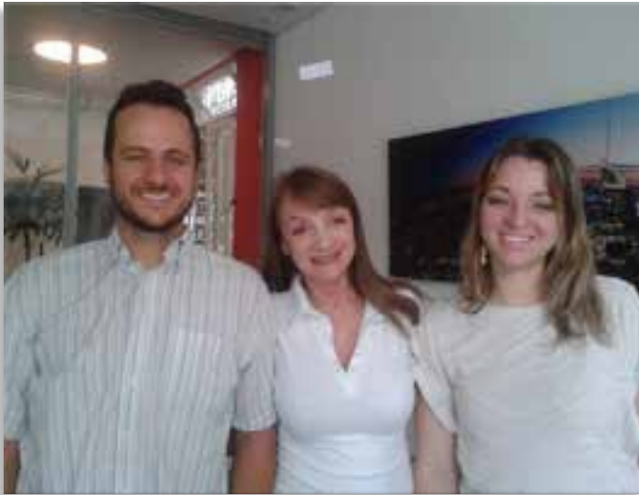
Equipe da Alalux.