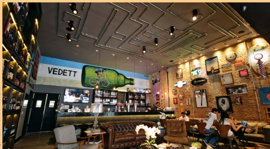
Ugo Nitzsche/Gênero Produções