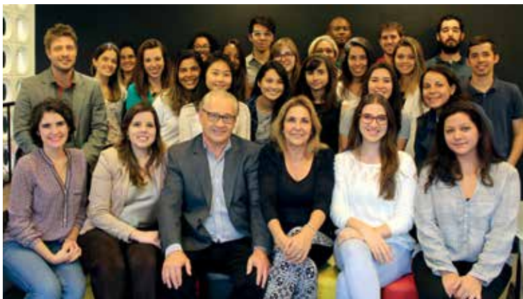
Equipe da Mingrone Iluminação.