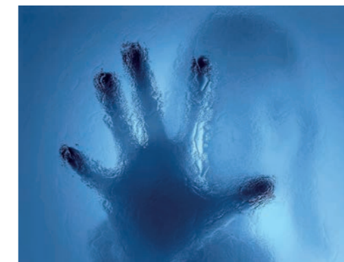
Síndrome do pânico.

A partir de 1929 atuaria como analista leigo, já que não possuía titulação médica. Em 1930, assumiu a diretoria do Instituto de Pesquisas Sociais de Frankfurt, o que provavelmente o levou a alinhar seus pensamentos de psicanalista mais ainda com uma socio-