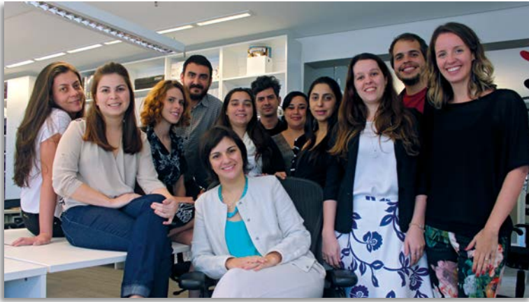
Equipe Foco Luz & Desenho.