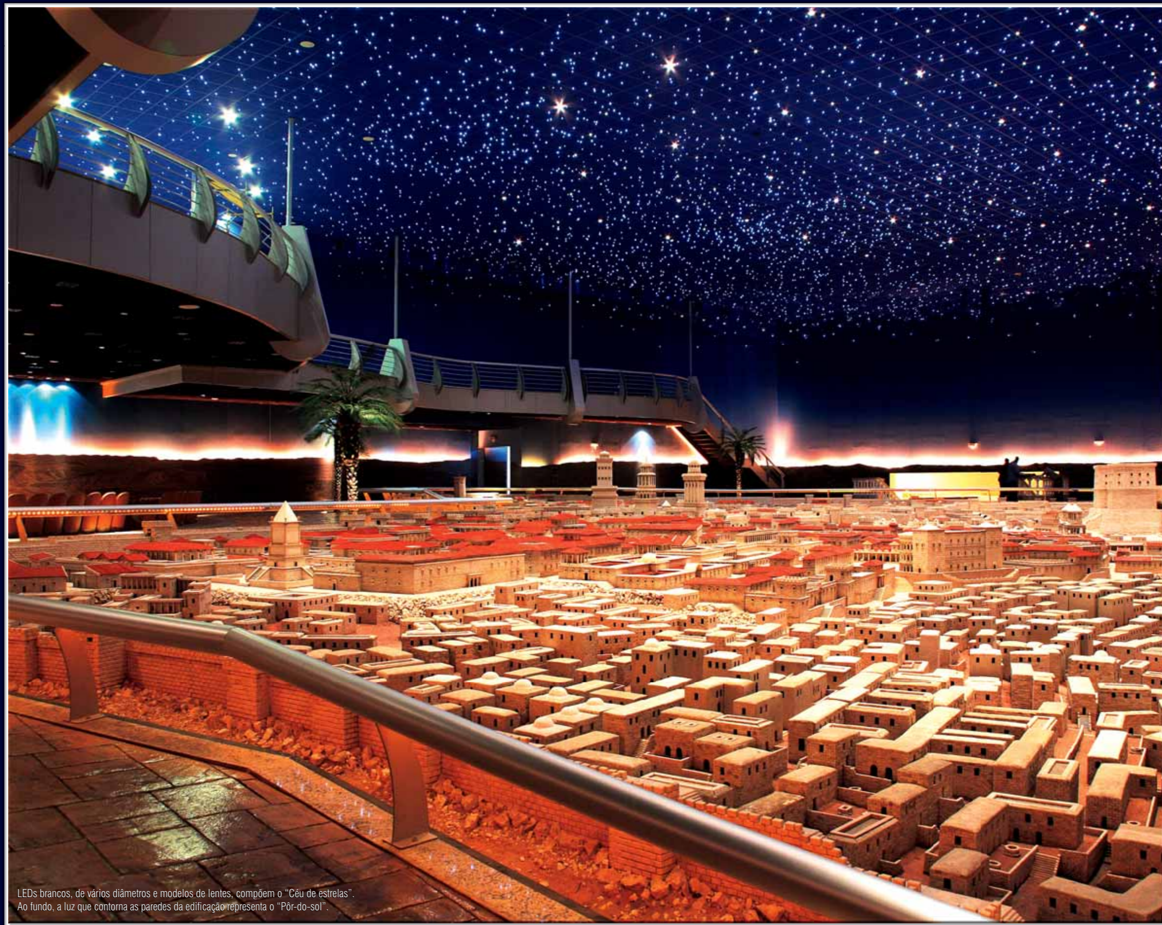
LEDs brancos, de vários diâmetros e modelos de lentes, compõem o “Céu de estrelas”. Ao fundo, a luz que contorna as paredes da edificação representa o “Pôr-do-sol”.

Os sistemas de iluminação também interagem, de forma sincronizada, com totens multimídia, que contam detalhes e curiosidades de construções, como: o templo, a tumba de Davi, o palácio de Herodes, o anfiteatro, a fortaleza de Antônia, entre outras.