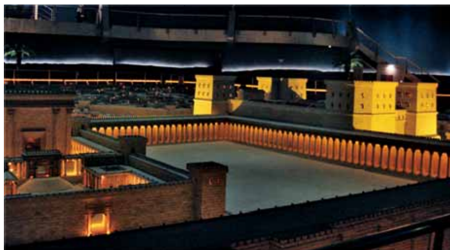
Luz âmbar, fornecida por LEDs instalados na parte interna dos edifícios, integra o efeito “Luz de velas”.

Para criar o efeito “Nascer do dia”, o lighting designer criou um “teto refletido” no perímetro da maquete, com 1400 LEDs de luz branca, 1W, a 3000K. As peças, embutidas no forro, acompanham o percurso da muralha que envolve a cidade e, por meio de automação, são acesas gradativamente.